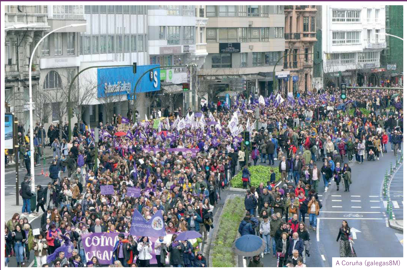
A Coruña (galegas8M)