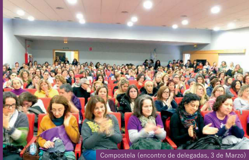
Compostela (encontro de delegadas, 3 de Marzo)