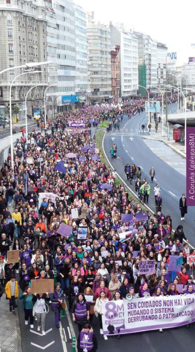
A Coruña (galegas8M)